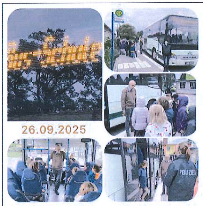
Die 1. Klasse der Grundschule Hohenbucko

Erstklässler sollen sicher auf dem Schulweg sein. Dazu zählt auch die Busfahrt. Nun wissen wir ganz genau, wie es geht.